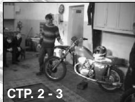
СТР. 2 - 3

=10 AB, /"C,!D %" . $1*, , C,*$&' $,E,%(' 5,EGH - 5"*0. ?/!1D/1 $E,I1 (%0,* ,E%1I1 C*1(J1K!1 $ E0,% "L N,%0*" .,0E/1I1 0,L%(O,E/1I1 0$1*O,E0$". P15"%." N,%0*" .,0E/1I1 0,L%(O,E/1I1 0$1*O,E0$" $,*%A!"ED (J Q1*1.(%1, I., E1E01G!EG 3 /*", $1' «?(R(*E/( ' 0,L%1- E"!1%». S"J $ . $" I1." U%&, 0,L%( / ( E1R(*"UOEG $5,E0,, 001R& C* ,.E0"$ (OD BU* ( E$1( *"R10&. VO" $&E0"$ /" A%(/"!D%", 1%" C*1L1.(0 $ *"5/"L W/EC,* (5,%0" 01!D/1 $ P*"E%1G*E/15 /*",.