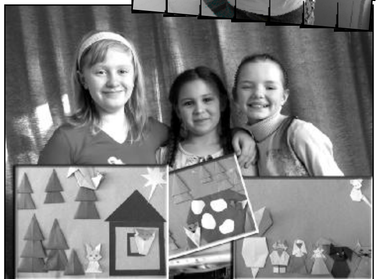
Записала интервью, а также фотографировала Гульфия РАХИМОВА, студия «Лабиринт +».

S,.,"/01* - 3"5"" 6868; ;=6 =, *E0/"- e*(%" Y \fP\=gSe86.