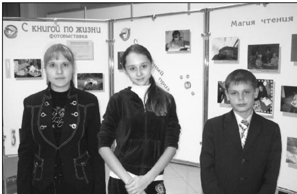
На фоне краевой выставки «С книгой по жизни».