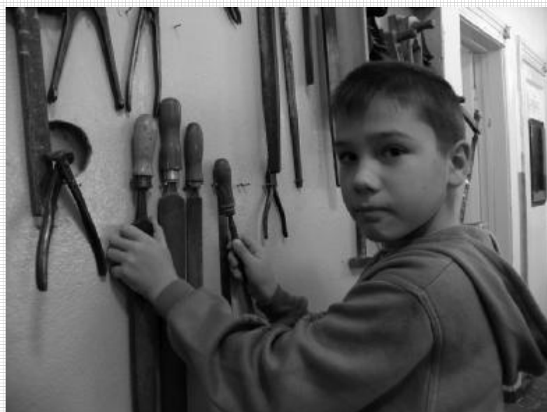
РЕДАКТОР - Тамара АНАНЬЕВА. ВЕРСТКА - Ирина ПОДКОВЫРИНА.