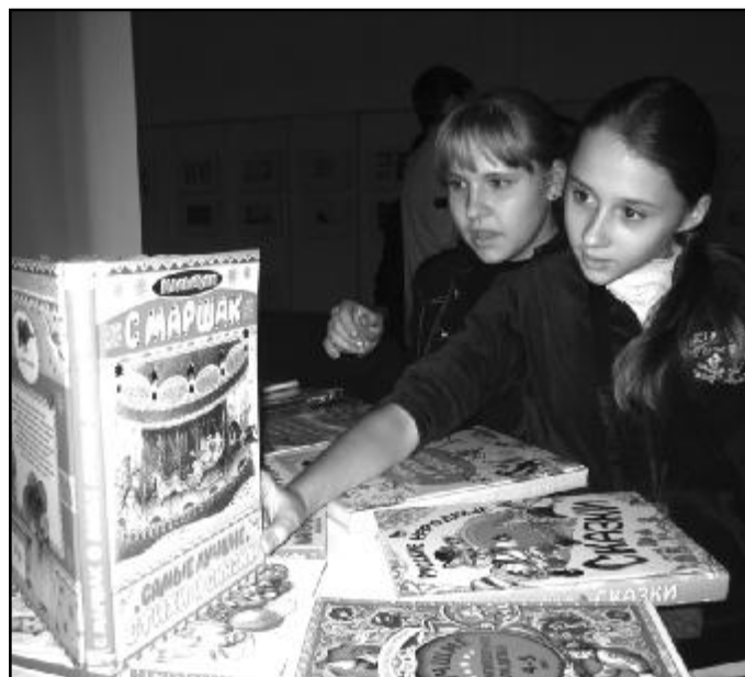
Центр детского технического творчества г. Канска «Энергия нового поколения» > Выпуск № 5 > 23 декабря 2007 г.