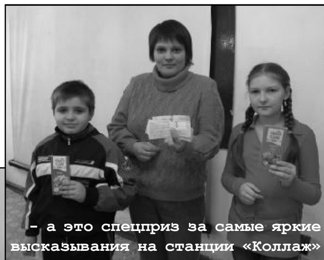
- а это спецприз за самые яркие высказывания на станции «Коллаж»