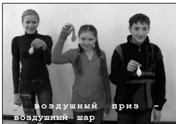
- воздушный приз - воздушный шар