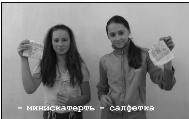
- минискатерть - салфетка