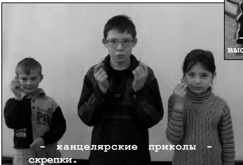
- канцелярские приколы - скрепки.

Мне этот праздник запомнится надолго и оставит самые яркие впечатления!