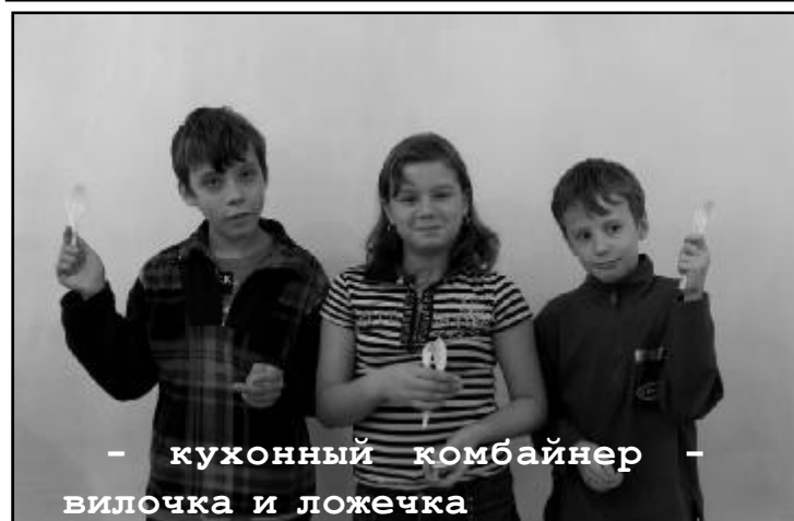
- кухонный комбайнер - вилочка и ложечка