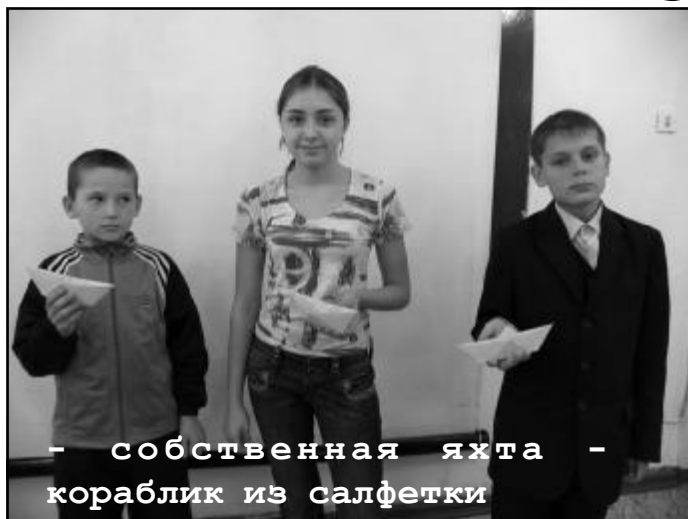
- собственная яхта - кораблик из салфетки