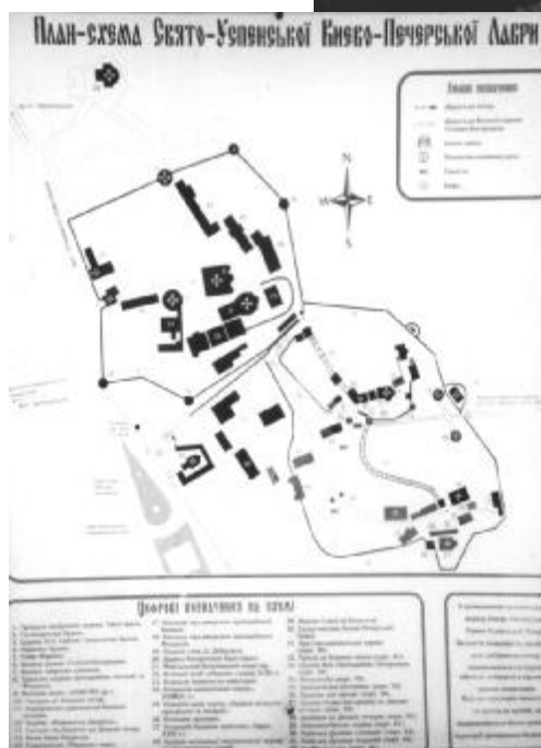
Киево-Печерская лавра – действующий монастырь.

года в Киево-Печерской лавре велись восстановительные и реставрационные работы. С конца 1980-х годов началось возрождение монашеской жизни в лавре.